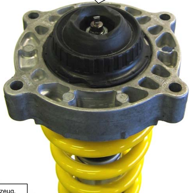
Eingebautes Federbein im Fahrzeug. Assembled coilover strut in the car.

Bei Dämpferausführungen mit Druckausgleichsbehälter ist dieser, wie auf dem Bild zu sehen, zur Fahrzeugheckseite zu montieren.