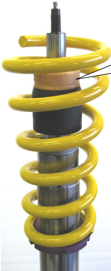
Angeliefertes Federbein. Supplied coilover strut.

Put the original supporting bearing on the coilover strut and fix it with the supplied stopp nut. Tightening torque for the piston rod is 35 Nm (26 ft-lb). Please install the strut unit to manufacturers recommended settings regarding tightening torque and fixing specifications.